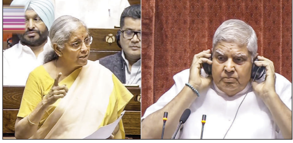
ਵਿੱਤ ਮੰਤਰੀ ਨਿਰਮਲਾ ਸੀਤਾਰਮਨ ਨੇ ਅੱਜ ਰਾਜ ਸਭਾ ਵਿੱਚ ਵਿੱਤ ਬਿੱਲ 2024-25 ਅਤੇ ਜੰਮੂ-ਕਸ਼ਮੀਰ ਨਾਲ ਸਬੰਧਤ ਵਿਨਿਯੋਜਨ ਬਿੱਲਾਂ 'ਤੇ ਹੋਈ ਸਾਂਝੀ ਚਰਚਾ ਦਾ ਜਵਾਬ ਦਿਤਾ, ਜਿਸ ਤੋਂ ਬਾਅਦ ਉੱਚ ਸਦਨ ਨੇ ਉਨ੍ਹਾਂ ਨੂੰ ਆਵਾਜ਼ ਵੋਟ ਰਾਹੀਂ ਲੋਕ ਸਭਾ ਵਿੱਚ ਵਾਪਸ ਕਰ ਦਿਤਾ। ਲੋਕ ਸਭਾ ਨੇ ਬੁਧਵਾਰ ਨੂੰ ਵਿੱਤ (ਨੰਬਰ 2) ਬਿੱਲ, 2024 ਨੂੰ 45 ਸਰਕਾਰੀ ਸੇਵਾ ਨਾਲ ਆਵਾਜ਼ ਵੋਟ ਨਾਲ ਪਾਸ ਕਰ ਦਿਤਾ।

ਨਵੀਂ ਦਿੱਲੀ, 8 ਅਗੱਸਤ : ਸੰਸਦ ਨੇ ਵੀਰਵਾਰ ਨੂੰ ਆਮ ਬਜਟ 2024-25, ਜੰਮੂ ਅਤੇ ਕਸ਼ਮੀਰ ਦੇ ਬਜਟ 2024-25 ਅਤੇ ਉਨ੍ਹਾਂ ਨਾਲ ਸਬੰਧਤ ਵਿਨਿਯੋਜਨ ਬਿੱਲਾਂ ਨੂੰ ਮਨਜ਼ੂਰੀ ਦੇ ਦਿਤੀ ਹੈ।