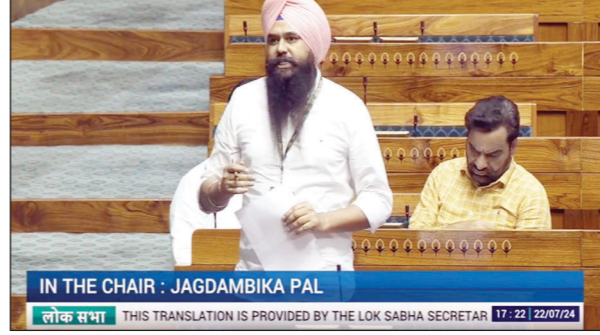
‘ਆਪ’ ਸੰਸਦ ਨੇ ਲੋਕ ਸਭਾ 'ਚ ਕੀਤੀ ਮੰਗ